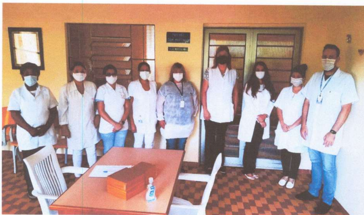
Profissionais da Área de Saúde